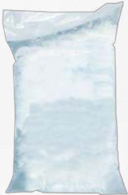
Bolsa de agua