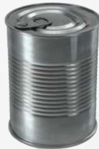
Latas de conservas