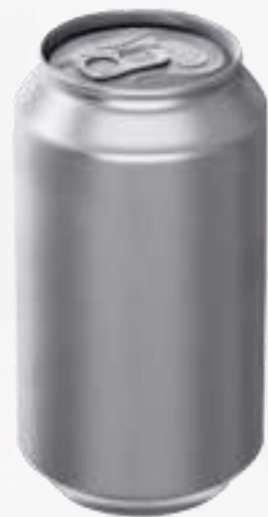
Latas de refrescos y cerveza