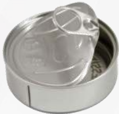
Latas de atún