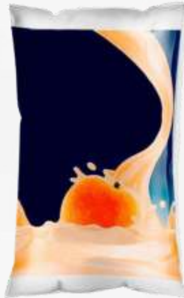
Bolsa de yogurt/ leche