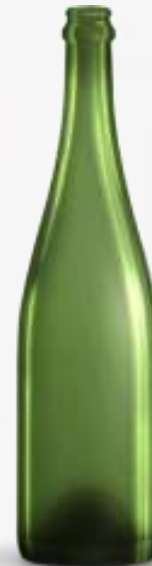
Botellas de vino