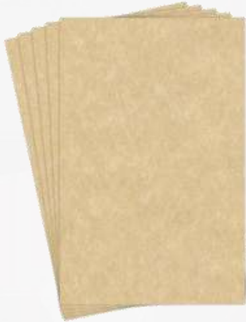
Papel y cartón