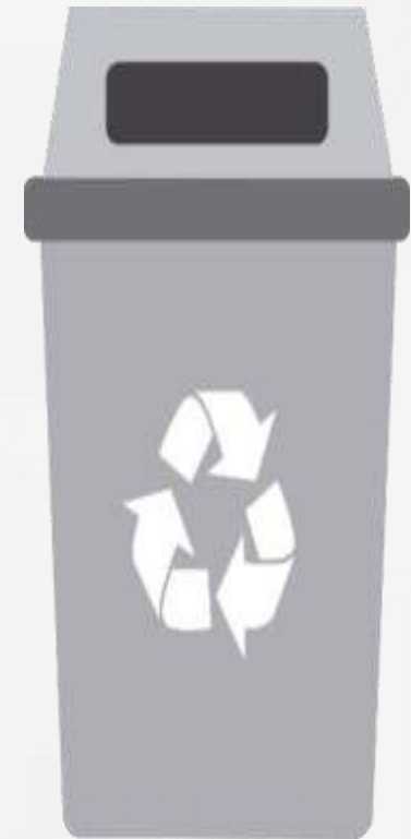
Aprovechable papel y cartón