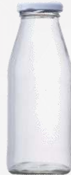
Botellas de jugo