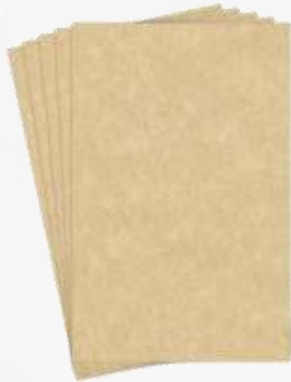
Hojas de papel