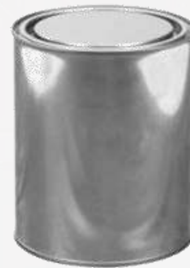
Latas de pintura