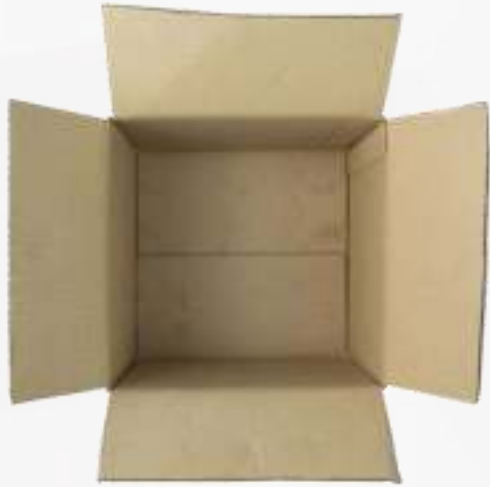
Cajas de cartón