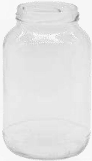
Envases de salsas